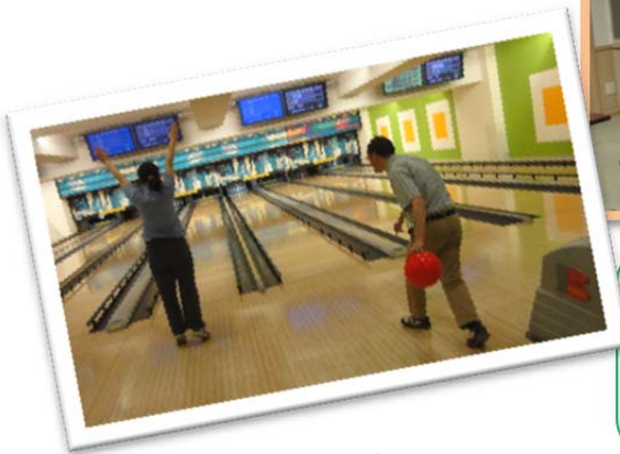
とくていひ えいりかつどうほうじん 特定非営利活動法人